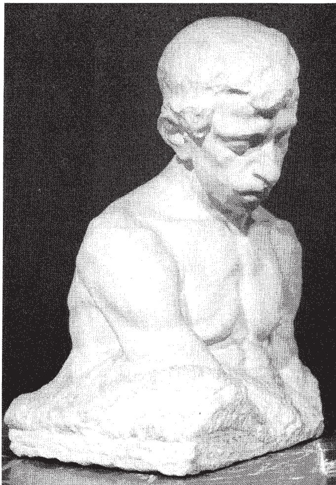
«Il Dolore». (Statua dello scultore Pandolfi donata al Museo delle Belle Arti di Lugano)

Diversi furono i maestri che durante l'assedio del castello di Lugano, nel 1512, prestarono la loro attività nelle opere offensive. Fra essi i registri delle spese comunicative annoverano Primo da Rovello, 1499, 1512, 1513; bolletta dell'11 aprile 1513 intascò il maestro quasi lirette 6 per certi lavori da lui compiuti intorno a quel castello, non si comprende se durante l'assedio o dopo la resa e l'uscita dei francesi, seguita, com'è saputo, il 26 gennaio 1513.